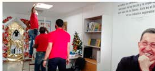
El equipo de servicios generales instalando luminarias en el área de Atención Médica