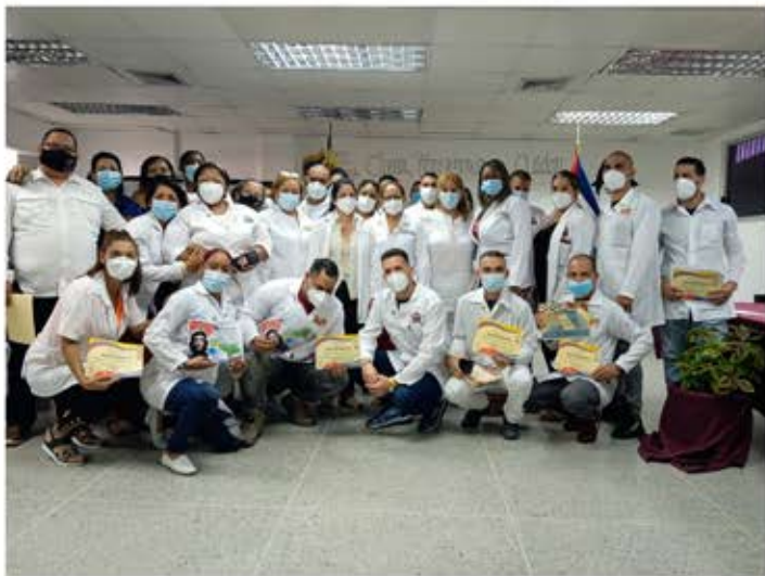
Entrega de Reconocimientos a la Brigada Antonio Maceo de la Misión Médica Cubana por su excelente labor