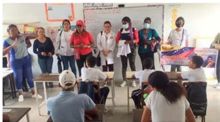
Visita del Equipo Médico de Fundagenética al Municipio Brión