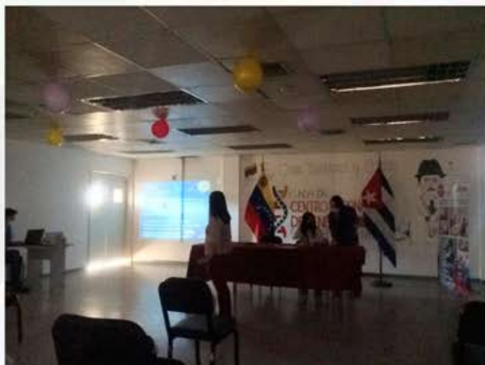
Lcda. Zulay Contreras al frente de la ponencia, disertando temas del módulo I