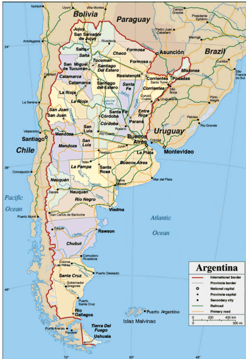
Imagen N° 1: Mapa de la República Argentina

En todos los programas analizados se encuentran las disciplinas identificadas en el taller de Enseñanza de la APS en las Escuelas de Enfermería del Cono Sur, aunque las denominaciones varían: enfermería comunitaria, salud comunitaria, salud pública, epidemiología, investigación en salud, investigación en enfermería, además de las materias relativas al cuidado de grupos específicos de la población: cuidado de los jóvenes, del niño, del anciano, de la mujer embarazada, etc.