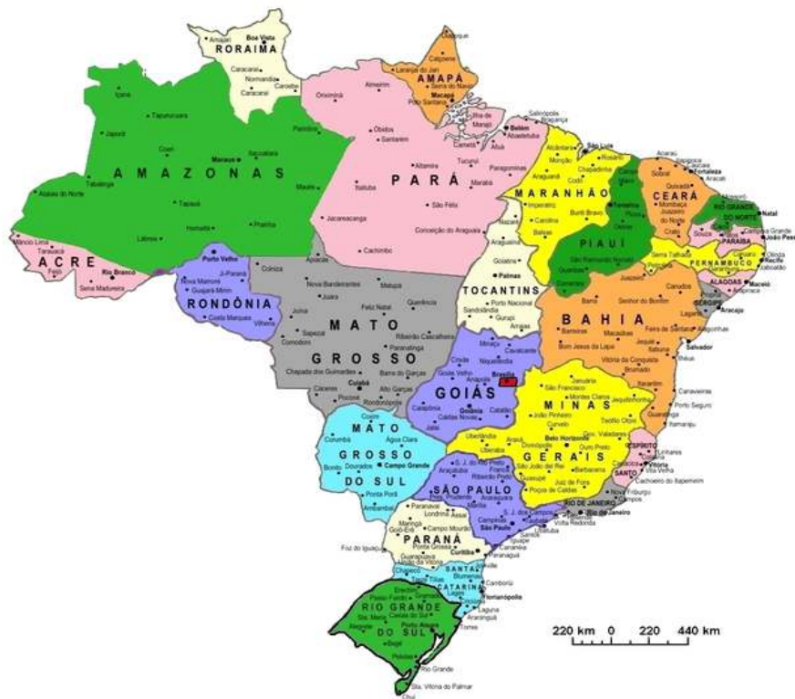
Imagen Nº 2: Mapa de Brasil

Universidade Federal de Rio Grande do Sul Universidade Federal de Rio de Janeiro Universidade Federal de Minas Gerais Universidade Federal de Santa Catarina Universidade Federal de Ceará Universidade Federal de Paraná Universidade Nacional de Brasília Universidade Federal de Bahia Universidade Federal de São Paulo Universidade Federal de Amapá Universidade Federal de Maranhão Universidade Federal de Pernambuco Universidade Federal de Paraíba Universidade Federal de Sergipe Universidade Federal de Espírito Santo Universidade Federal de Goiás Universidade Federal de Rio Grande do Norte Universidade Federal de Tocantins Universidade Federal de Pará Universidade Federal de Alagoas