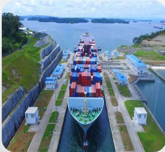
CANAL DE PANAMA