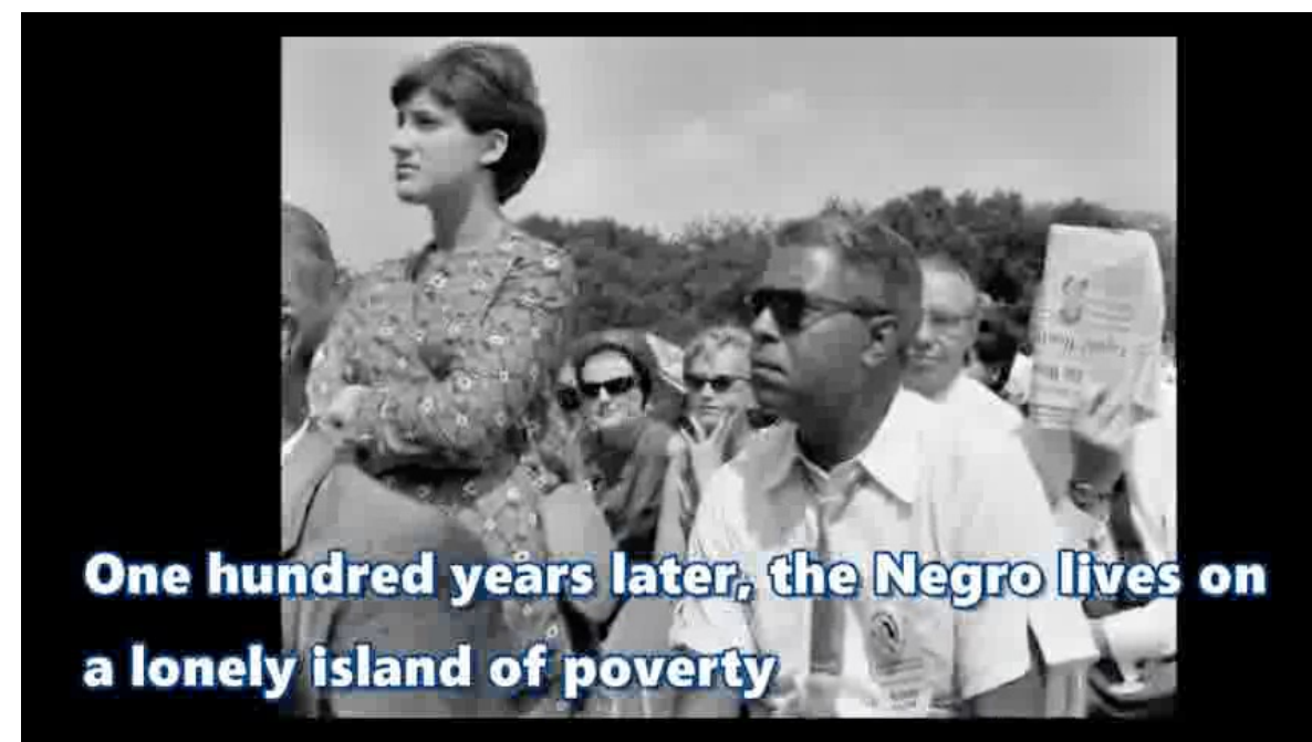
Martin Luther King