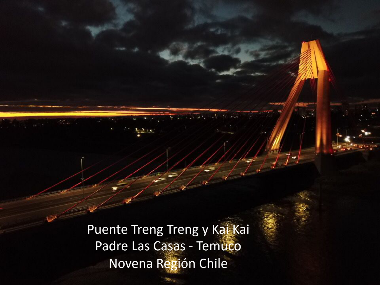
Puente Treng Treng y Kai Kai Padre Las Casas - Temuco Novena Región Chile