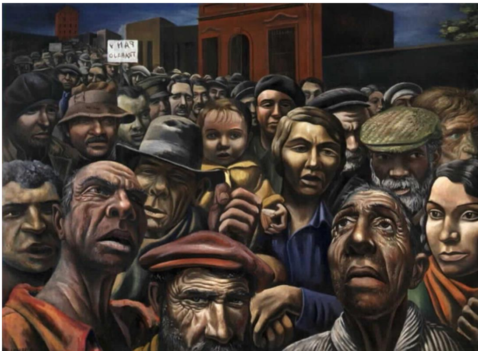
Antonio Berni, Manifestación, 1934