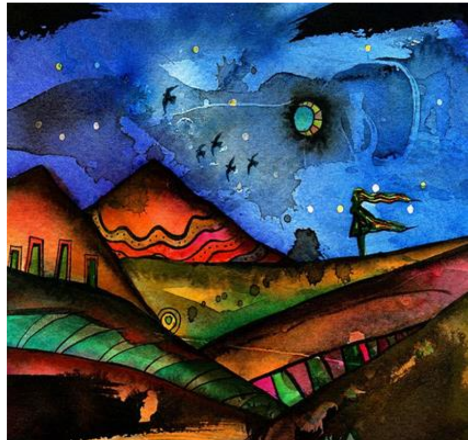
La Despedida, Vladimir Merchensky