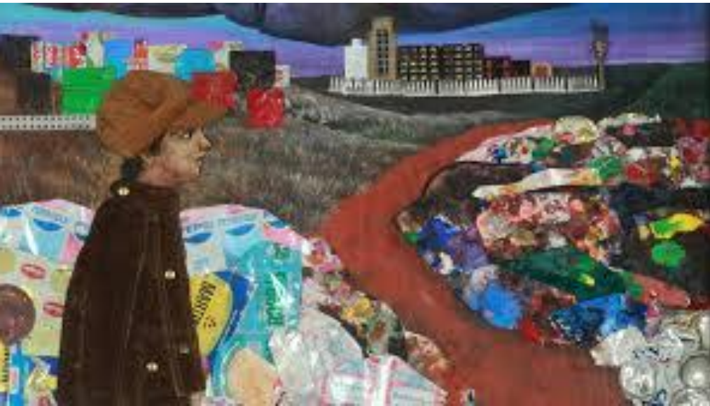
Historia de Juanito Laguna, Antonio Berni